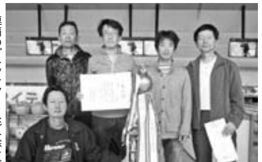
連覇のプレッシャーを跳ね除け、今年も優勝の栄冠に輝いた戸出Aチームのメンバー

日時:平成29年4月2日(日) AM 9:30スタート 場所:富山地鉄ゴールデンボウル 参加者:42チーム(210名)