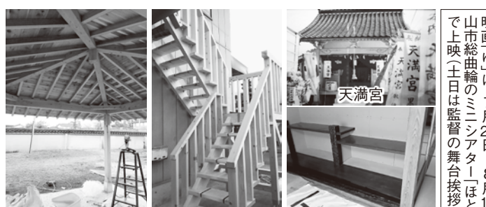
▲浜黒崎の蕎麦屋「松清庵」のオール杉でできた東屋(左)とオール松の外部階段(右) ▲カリンの天板、ローズウッドの束、黒檀の樫、タモの地板の違い棚

こで1年間現場監督を務めながら様々なことを教わった後、大工になった。 Q 一般住宅以外で印象に残っている仕事は? A 地元水橋の水神社や天満宮など。自分は宮大工ではないが、父の親方が宮大工で、父自身も寺の釣鐘堂を造っていたこともあって、若い頃から宮仕事が好きだった。神社仏閣を見るのも好きで、奈良や京都に何度も出かけ細部のつくりをじっくり観察した。一番お気に入りの建物は、最後の宮大工、故西岡常一氏が再建した薬師寺西塔。リズムがあつて美しい塔だと思つた。 Q これまでいろいろな仕事を手がけてきたと思うが、高校の終わり頃、先輩に誘われ青年団に参加した。それがきっかけでいろいろな人の横のつながりが大きく広がり、多くの友人もでき、仕事も受注させてもらった。職人同士の集まりではなく、一般の方との繋がりがこそが仕事の受注に繋がる。今でもこうして大工の仕事が続けられているのも、横のつながりがあつてこそ。若い時からい