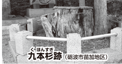
九本杉跡(砺波市苗加地区)

七月も半ばに差し掛かると暑さで食欲が失せまします。こんな日にや素麺でしょう。我が砺波には「大門素麺」があります。砺波市大門地区で今も変わらず作り続けられている「大門素麺」。昭和初期には60軒以上の農家で作られていましたが、今は10軒の生産者が伝統的な形と味を守り伝えていきます。まさに職人技ですね。昔ながらの袋に生産者の名前が入っているのも職人の魂を感じさせます。