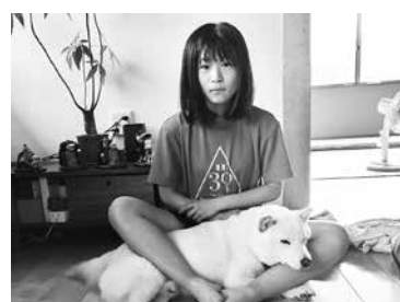
写真・文/三島 楓叶さん

私のお父さんは大工をしています。私の家は私のおじいちゃんとお父さんが作りました。木がたくさん使ったため、とても温かみがあります。また、友達が家に遊びに来たときも「おしゃれたね」、「いい匂い」といつてくれます。私が産まれたときからこの家に住んでいるので分らないですが、木を多く使っている家は、多くないと聞きました。ここまで使う木にこだわり、家にこだわっていることがすごいと思いました。お客さんの家をつくるときには、自分の寝室を見せたり子供部屋を見せたりしています。お客さんの話を聞いたり、要望に応じて部屋をこわしたりと、お客さんが楽しく暮らすための家をつくってほしいと思います。