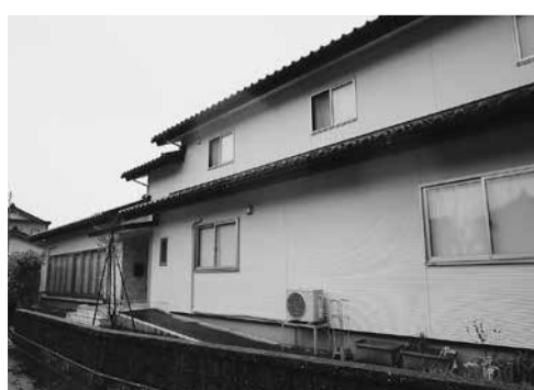
▲3代にわたり手掛けた家(朝日町内)