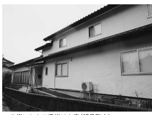
▲3代にわたり手掛けた家(朝日町内)

県連での会員情報の変更は、従来、会員からの建設国保への変更届により行っていましたが、本年12月からのマイナ保険証利用に伴い、建設国保の届出様式が変更され従来に比べ多くの個人情報記載されるようになります。 このため今後は、法律上の問題点を考慮して、会員から県連へ情報を提供していただくよう様式を変更しますので、よろしくお願います。 なお本内容は県連ホームページに掲載しています。