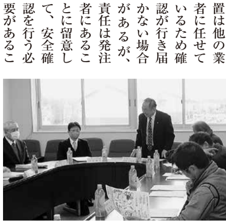
●令和6年度安全パトロール実施件数 (単位:件)

12月16日(月)13時30分より県連会議室で開催されました。県連からは会長・副会長と各地協選出の安全指導者、富山労働局の川倉健康安全課課長、防災防の上田専務が参加し、今年、実施した安全パトロールの実施結果、来年度の労働安全対策事業計画等について報告・協議を行いました。 このなかで安全指導員より、安全パトロール実施した結果として、指摘件数は減少しているが足場の設置に関する不備が多くみられたことや、暑い時期の熱中症対策に留意する必要があることなどが報告されました。 足場の設置は他の業者に任せているため確認が行き届かない場合があるが、責任は発注者にあることに留意して、安全確認を行う必要があること