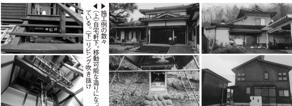
◀▶ 施工例の数々 (上)自宅軒下。移動可能な造りになっている。(下)リビング吹き抜け

い。今度、建設会社のお客さんから新築1軒を直接依頼され請け負うことになった。無事完成した後、今度は地元の方から建築の依頼をいただいた。それが終わると親族の家から...というようになぜか依頼が次々と続き、意図せず大工として独立することになった。勤めていた会社がなくなった後、営業経験もなく顧客ももたない自分が今後大工としてどうしたものかと不安に思っていたが、ありがたいことに依頼が続き今に至っている。